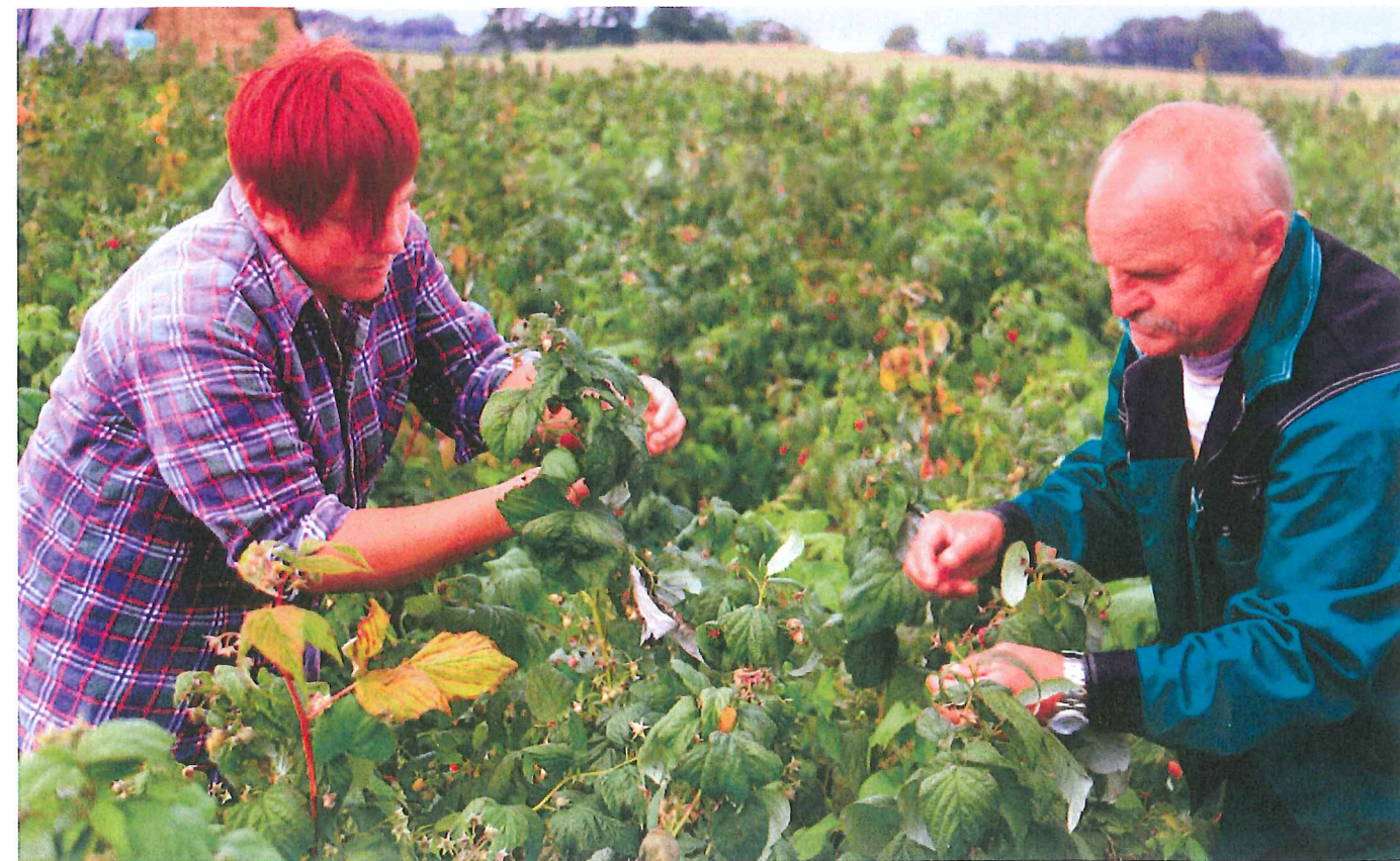
HORTITERAPIA – OGRÓD ZIOŁOWY DLA OSÓB NIEPEŁNOSPRAWNYCH

Projekt Wiejski Fundacji im. Stanisława Karłowskiego jest przykładem gospodarstwa naukowo-badawczego, które działa zarówno lokalnie jak i globalnie. ■